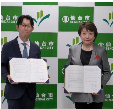
(写真 左：世古理事長 右：郡市長)