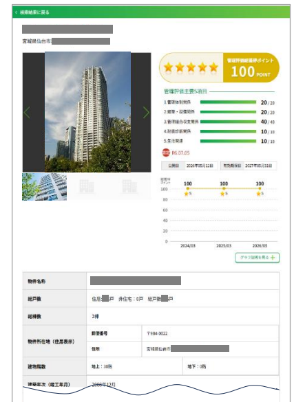
（専用サイトイメージ。一部加工してあります）